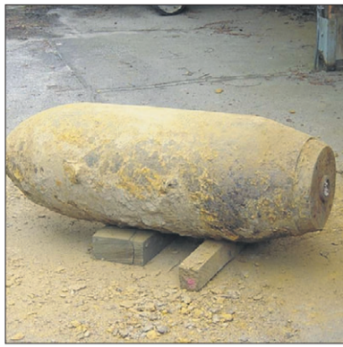
Gemiddeld worden in Kleef elk jaar een tot twee blindgangers onschadelijk gemaakt.

KLEEF. Nog steeds wordt het Duitse Kleef geregeld geconfronteerd met zogenaamde 'blindgangers' uit de Tweede Wereldoorlog. De stad werd op 7 oktober 1944 en 7 februari 1945 door geallieerde vliegtuigen zwaar gebombardeerd. Niet alle bommen explodeerden en bleven als 'blindgangers' in de bodem achter. Het zijn deze projectielen die ook nu nog bij werkzaamheden of nieuwbouw in de stad aan de oppervlakte komen. De Rozet-redactie wilde hierover meer weten en stuurde een korte vragenlijst in. Hieronder volgt een verkorte weergave van de antwoorden uit Kleef. (HM)