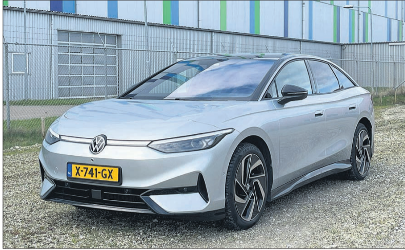
De Volkswagen ID.7 is een comfortabele reisauto, waarmee men op een batterijlading ver kan komen.

Volkswagen introduceert met de ID.7 weer een grote sedan, zoals de inmiddels uit de markt genomen Phaeton. Met de ID.7 richt Volkswagen zich opnieuw op het topsegment. Echter in de ID.7 zit geen grote benzine-motor, maar de nieuwste generatie elektromotor van het Volkswagen concern. In de Passat en Phaeton hadden we vroeger zelfs de W12, een twaalfcilinder motor, maar dat kan vanwege milieueisen tegenwoordig niet meer.