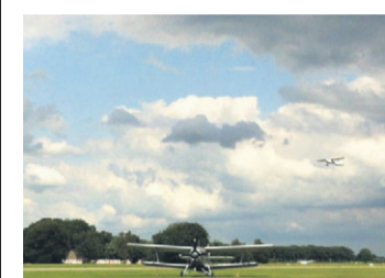
“Dan kan ik weer vliegen”