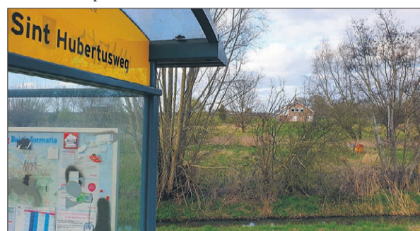
Sint Hubertusweg 11 in het groen