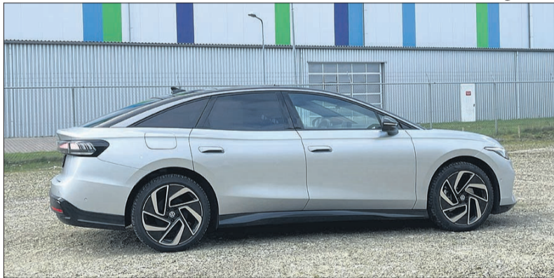
De Volkswagen ID.7 lijkt een sedan, maar heeft toch een grote achterklep, waarachter men veel bagage kan verstouwen.

De ID.7 lijkt op een sedan, maar heeft toch een vijfde deur. Hierachter schuilt een grote bagageruimte met enorme laadlengte en een inhoud van 532 liter. Bij het neerklappen van de achterbank ontstaat zelfs een laadruim van 1586