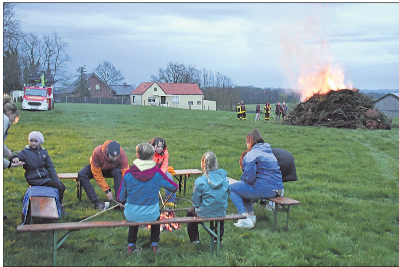
De jeugd zit aan de marshmallows bij heet paasvuur in Wyler

Het vuur werd een uur later aangestoken dan normaal omdat op het geplande tijdstip de regen met bakken uit de hemel kwam. Voor de bezoekers werd het een gezellige avond.